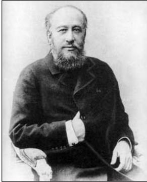
Лазарь Бродский (1848—1904)

100 лет тому назад — 3 (16) июля 1912 г. — был освящен и открыт первый в Киеве крытый рынок — Бессарабский. И обязаны киевляне этим Лазарю Бродскому.