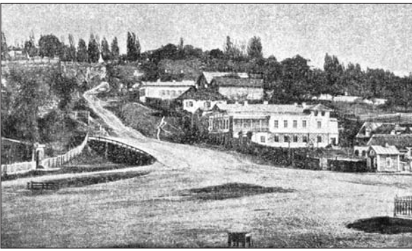
Бессарабка. Середина 1860-х