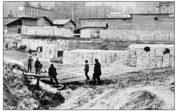
Строительство Бессарабского рынка. 1910

Комиссия постановила конкурс проектов не объявлять, а поручить архитекторам Э. Брадтману, Г. Гаю, А. Кобелеву, А. Кривошееву, А. Минкусу до 20 апреля 1908 г. подать свои предложения. При этом комиссия определила некоторые технические условия, о которых пресса проинформировала читателей: «В проект крытого рынка включен также проект городской публичной библиотеки, главного центрального павильона рынка, цветочного рынка и других мелких сооружений. Не желая выходить с базаром и торговыми рядами прямо на главную улицу города, в одном из центральных мест ее, постановлено перед зданием главного павильона рынка устроить здание городской публичной библиотеки, которое и должно собой закрыть базарную площадь. Это здание по своей солидности и красивому строгому внешнему виду должно украсить это место города, а за этим зданием уже расположится рынок. Под здание публичной библиотеки отводится площадь около 300 кв. сажень, под главный центральный павильон рынка — около 950 кв. саж. (1 кв. саж. = 4,55 кв. м. — В. К.). Для библиотеки проектируется каменное здание в два этажа с под-