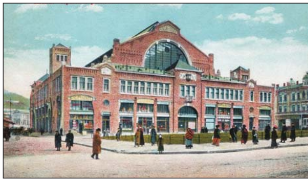
Крытый рынок. 1912

Это решение касалось рынка, средства на который завещал сахарозаводчик, меценат, щедрый благотворитель, кавалер российских орденов св. Станислава, св. Анны, св. Владимира и французского ордена Почетного легиона Лазарь Бродский (1848—1904). Он оставил городу 500 тыс. руб. для строительства рынка на Бессарабке, чтобы потом с его доходов ежегодно отчислялось 22,5 тыс. руб. на содержание Бактериологического института, детского отделения при Ерейской больнице, училища им. С. Бродского, двух благотворительных учреждений и на стипендии учащихся.